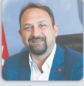
Konuşmacı: Utku Gümrükçü Çiğli Belediye Başkanı